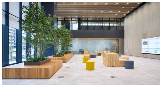
2024 受賞作品 アーバンネット仙台中央ビル室内緑化デザイン