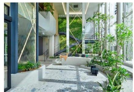
2024 受賞作品 東急不動産 BRANZ ギャラリー 表参道