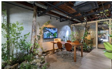
2024 受賞作品 王子ホールディングス（株）本社1階