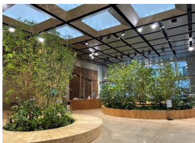
キングス（株）本社1階

受賞した作品の審査資料の使用権は屋内緑化推進協議会に帰属するものとし、会の出版物等に使用する権利を得たものとしします。