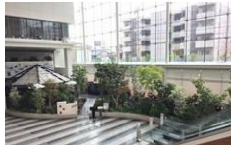
2018 受賞作品 Dsquare（デンソー社員倶楽部）