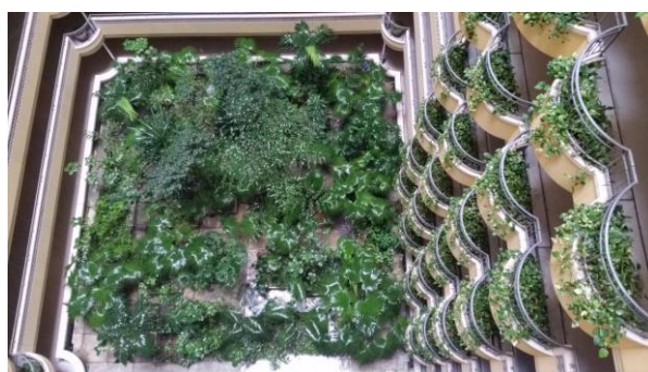
2018 受賞作品 ザ・ビーチタワー沖縄

入選した作品の審査資料の使用権は屋内緑化推進協議会に帰属するものとし、会の出版物等に使用する権利を得たものとしします。